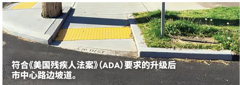
符合《美国残疾人法案》(ADA)要求的升级后市中心路边坡道。