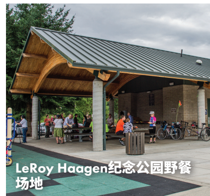
LeRoy Haagen纪念公园野餐场地

在线预约： cityofvancouver.us/picnicselters 。 了解更多信息，请致电：360-487-8304或发送电子邮件至： parkspicnics@cityofvancouver.us 。