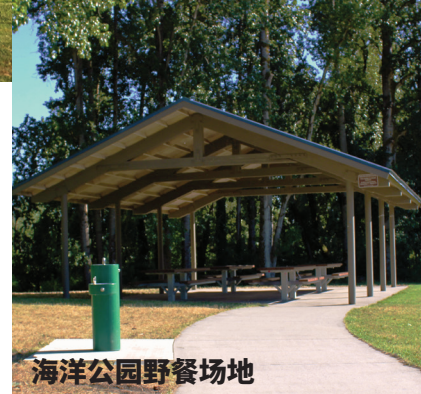
海洋公园野餐场地

是否计划在公园内举办活动？有些活动可能需要公园使用许可证，如婚礼、扩音音乐、慈善活动、大型聚会和充气弹跳屋。