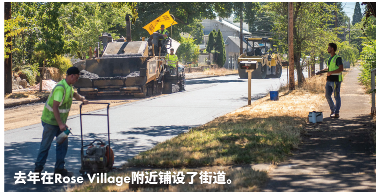
去年在Rose Village附近铺设了街道。

了解更多信息，请访问： cityofvancouver.us/pavement 。