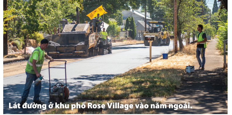
Lát đường ở khu phố Rose Village vào năm ngoái.

Công tác chuẩn bị cho việc lát đường được bắt đầu bằng hoạt động cắt tỉa cây và sửa chữa phủ kín các vết nứt gây