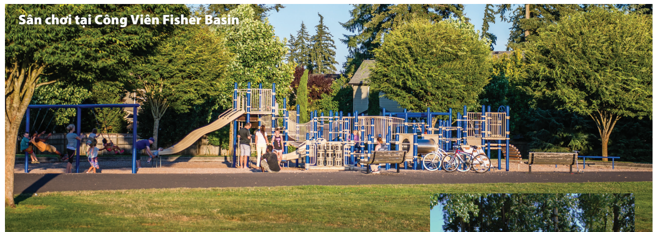
Sân chơi tại Công Viên Fisher Basin

Tìm thêm các mẹo về nước sạch tại cityofvancouver.us/cleanwatertips .