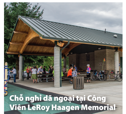
Chỗ nghỉ dã ngoại tại Công Viên LeRoy Haagen Memorial

Đặt trước chỗ nghỉ trực tuyến tại cityofvancouver.us/picnicselters . Để biết thông tin, xin liên hệ 360-487-8304 hoặc parkspicnicselters@cityofvancouver.us .