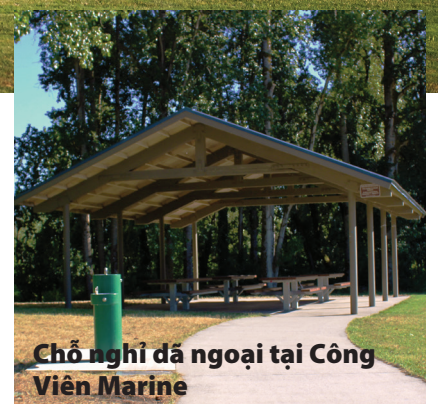
Chỗ nghỉ dã ngoại tại Công Viên Marine

Quý vị có kế hoạch tổ chức sự kiện tại công viên? Một số hoạt động có thể yêu cầu Giấy Phép Sử Dụng Công Viên, bao gồm đám cưới, sự kiện âm nhạc cường độ cao, các sự kiện từ thiện, các cuộc tụ họp có số lượng người quá lớn để tổ chức tại chỗ nghỉ và nhà hơi.