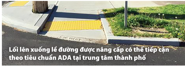
Lối lên xuống lề đường được nâng cấp có thể tiếp cận theo tiêu chuẩn ADA tại trung tâm thành phố

đọc theo đường phố một cách chủ động. Ngoài ra, các lối lên xuống lề đường tại khoảng 127 địa điểm hiện đang được nâng cấp để đáp ứng các tiêu chuẩn hiện hành theo Đạo Luật Người Mỹ Khuyết Tật (Americans with Disabilities Act, ADA) để cải thiện khả