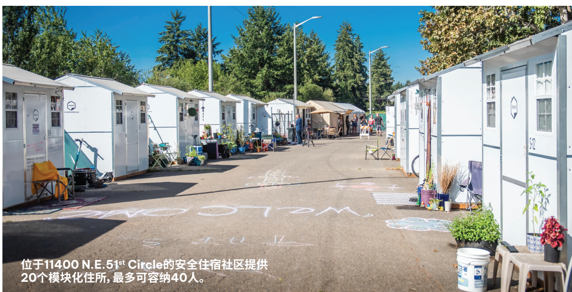
位于11400 N.E. 51 st Circle的安全住宿社区提供20个模块化住所,最多可容纳40人。

第一项命令可以提高财务灵活性——授权接受捐赠简化流程,获取预算需求财务储备,购买解决无家可归问题所需的商品和服务。第二项命令允许城市管理者根据需要开放或关闭特定公共地块供户外居住,解决此次人道主义危机,同时确保公共健康和卫生需求得到满足。预计还会颁布更多紧急命令和行动,如有针对性的收容和行为健康响应措施、执法工作协调,并最终建立一个具有支持和恢复服务的综合