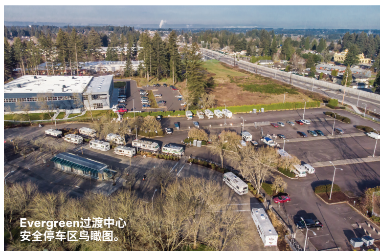
Evergreen过渡中心安全停车区鸟瞰图。