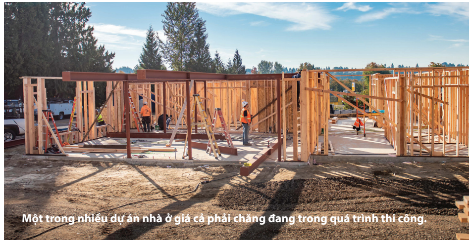
Một trong nhiều dự án nhà ở giá cả phải chăng đang trong quá trình thi công.

Không lâu sau khi nhận vị trí CNA đầu tiên, Courtney đã được đề nghị - và chấp nhận - một vị trí khác tại một cơ sở khác và mức lương của cô đã tăng gần 50 phần trăm.