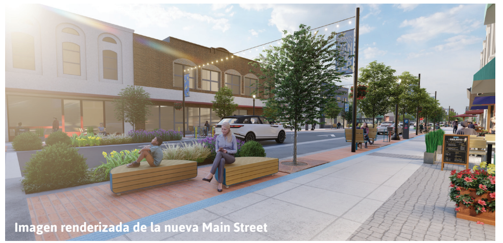
Imagen renderizada de la nueva Main Street

Los socios del programa ofrecen asesoramiento sobre la propiedad de viviendas y asistencia para el pago inicial para la compra de viviendas recientemente construidas. Para obtener más información y comenzar el proceso, visite cca.hp.org .