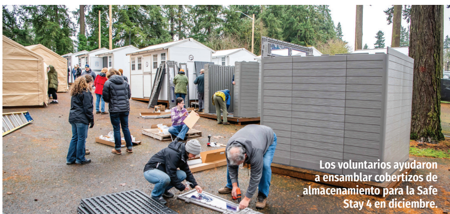
Los voluntarios ayudaron a ensamblar cobertizos de almacenamiento para la Safe Stay 4 en diciembre.

El boletín informativo de la Ciudad de Vancouver se publica trimestralmente para los residentes y para quienes reciben servicios de la ciudad.