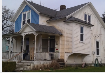
Vivienda del Programa de rehabilitación de viviendas antes (arriba) y después (abajo) de la renovación.

El Programa de rehabilitación de viviendas busca preservar el suministro de viviendas existente en Vancouver. Buscamos contratistas generales, plomeros, electricistas y otros oficios calificados que se ofrezcan y trabajen para el programa. Los contratistas pueden comprobar si están calificados visitando el Programa de rehabilitación de viviendas en cityofvancouver.us/housingrehab o comunicándose con justin.ventura@cityofvancouver.us .