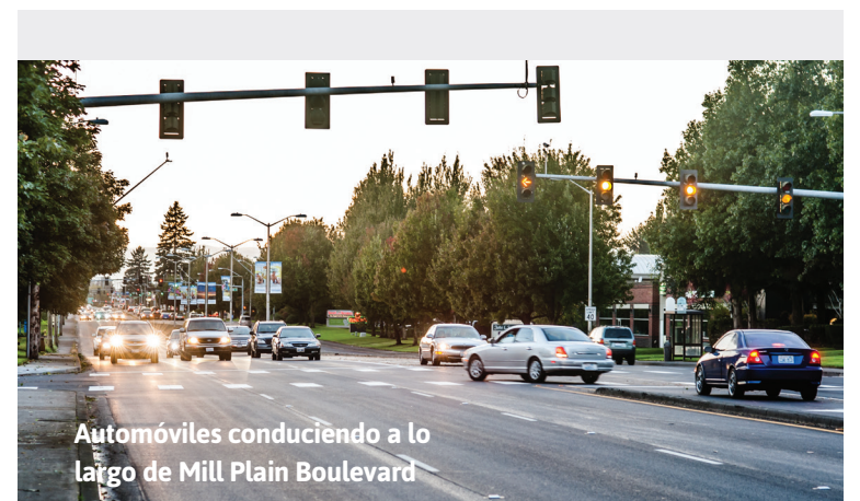
Automóviles conduciendo a lo largo de Mill Plain Boulevard

Escanee el código QR con la cámara de su teléfono o visite cityofvancouver.us/pfas para obtener más información sobre las PFAS y ver todos los resultados de las muestras.