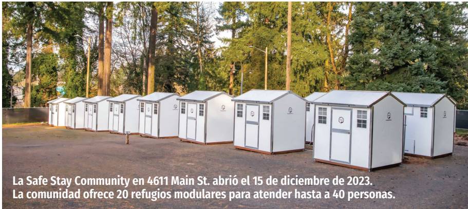
La Safe Stay Community en 4611 Main St. abrió el 15 de diciembre de 2023. La comunidad ofrece 20 refugios modulares para atender hasta a 40 personas.

La ciudad trabaja continuamente para abordar el problema de las personas sin hogar en nuestra comunidad. El pasado mes de noviembre, la ciudad declaró la emergencia de la situación de personas sin hogar en Vancouver para ayudar a ampliar y acelerar la respuesta de la ciudad ante el crecimiento en la complejidad y la magnitud de la crisis mediante iniciativas de la ciudad, como el Equipo de ayuda y recursos para personas sin hogar (Homelessness Assistance and Resources Team, HART) y su programa Safe Stay Community (Comunidad de estancia segura).