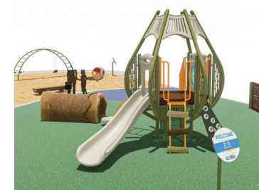
Imágenes renderizadas de los reemplazos de las áreas de juego en Columbia Lancaster (izquierda) y Van Vleet (arriba).