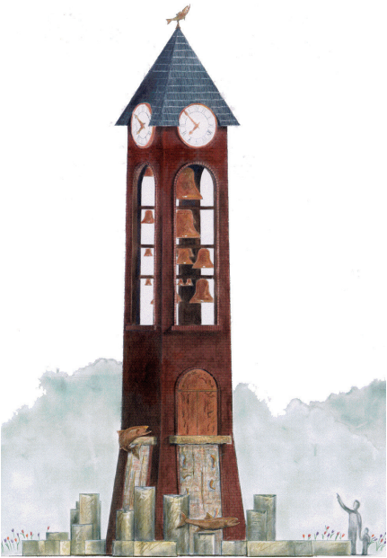
Оригинальное исполнение колокольни и гlockenшпиля Salmon Run до ее постройки в 2002 году.

Внимательно следите за событиями Чтобы следить за этим проектом, посетите сайт cityofvancouver.us/belltower .