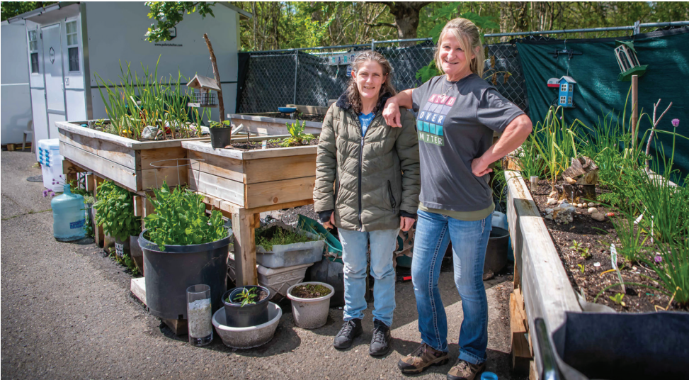
Общественный сад в The Outpost, первое Safe Stay в Vancouver.

Лица, совершившие правонарушения в отношении пригодности для жилья, могут быть привлечены полицией Vancouver в общественный суд. Эта программа предоставляет альтернативу тюремному заключению и судимости в обмен на выполнение общественных работ и регистрацию на лечение, психиатрическую помощь или другие необходимые услуги. Участники общественного суда теперь могут работать вместе с членами городской команды HART, убирая существующие или заброшенные лагеря, чтобы завершить рабочее время. Этим летом ищите их в заметных жилетах "Community Court". Чтобы закрепить успех этой программы, городские власти определили новое место суда и позднее