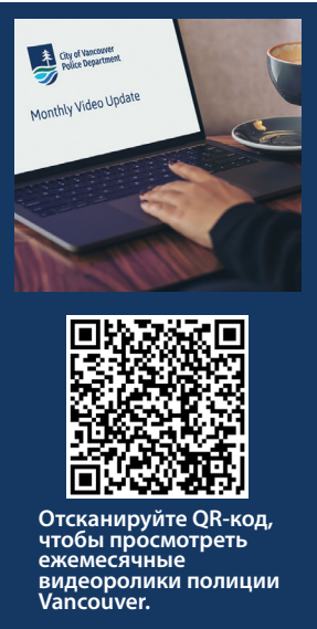
Отсканируйте QR-код, чтобы просмотреть ежемесячные видеоролики полиции Vancouver.

Ранее в этом году Департамент полиции Vancouver представил новую ежемесячную видеопрограмму. Эти короткие видеоролики — отличный способ увидеть, что происходит в VPD, познакомиться с нашими сотрудниками и получить обновленную информацию об инициативах департамента, мероприятиях, месяцах профилактики, а также узнать больше о различных подразделениях полицейского управления и типах программ, которыми они руководят. Все ежемесячные обновления можно найти на веб-сайте VPD, так что вы сможете узнать все, что пропустили. Вы также можете найти их во всех социальных сетях VPD, поэтому обязательно подписывайтесь на нас в Facebook и Instagram (@vancouverpoliceusa), Twitter (@vancouverpdusa) или Nextdoor.