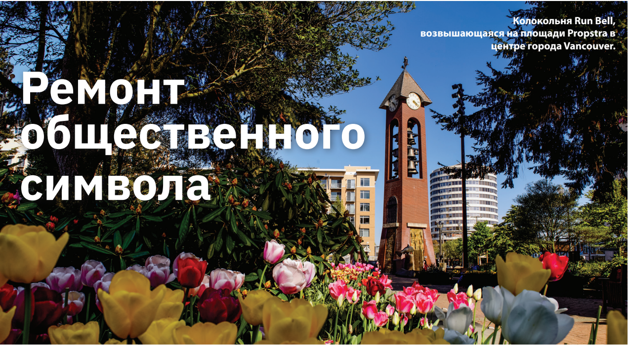
Колокольня Run Bell, возвышающаяся на площади Propstra в центре города Vancouver.