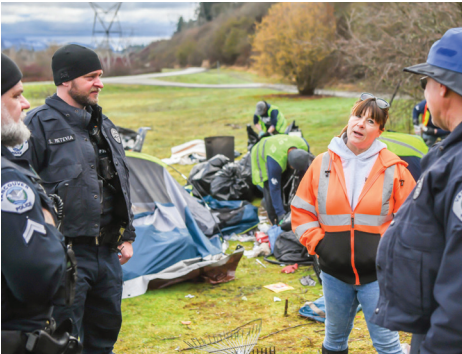
Команда по вопросам помощи и ресурсов для бездомных (HART) проводит уборку лагеря

С потеплением последствия бездомности становятся все более заметными. Городская команда по вопросам помощи и ресурсов для бездомных (Homeless Assistance and Resources Team, HART) служит ключевым контактным центром для ответа на вопросы и проблемы