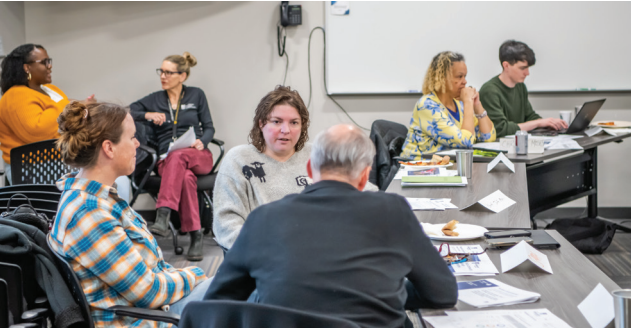
Недавно назначенный городской полицейский консультативный комитет сообщества собрался на свое первое заседание в апреле.