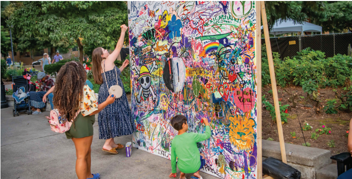
Погрузитесь в мир волнующего творчества на фестивале искусств и музыки в Vancouver, 2–4 августа . Это зрелищное мероприятие, бесплатное и открытое для всех возрастов, призвано превратить парк Esther Short и центр Vancouver в сцену художественного блеска.

Ловите лето и экономьте на специальных городских мероприятиях. Посетите сайт cityofvancouver.us/events и спланируйте свое идеальное лето в Souve.