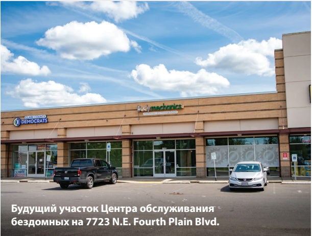
Будущий участок Центра обслуживания бездомных на 7723 N.E. Fourth Plain Blvd.

Это здание поможет Совету по делам бездомных удовлетворить растущие потребности в своих услугах, объединив персонал и службы под одной крышей. Ожидается, что новое здание откроется к концу года и предоставит 2500 членам сообщества услуги по доступу и поддержанию стабильного жилья.