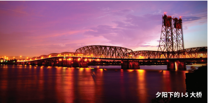
夕阳下的 I-5 大桥

Services Center（地址：13413 N.E. LeRoy Haagen Memorial Drive）举行社区座谈会，预计下一任警察局长将在 11 月中旬前上任。