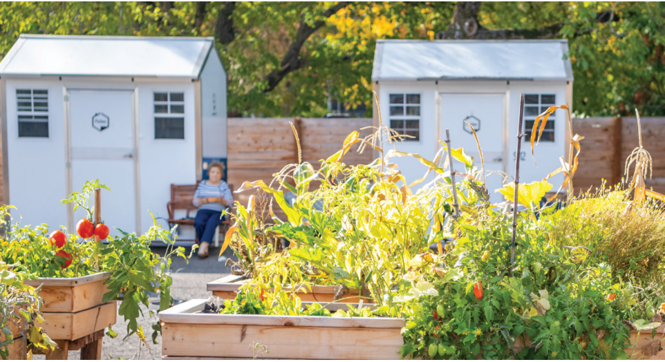
位于 415 West 的社区花园是一个 Safe Stay 社区。

本市的一系列 Safe 场所旨在满足社区的多样化需求，因为一刀切的做法并非实现稳定之路。