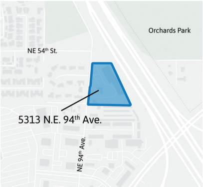
Переходной приют будет расположен по адресу 5313 N.E. 94th Ave.

Обновленная информация о проекте и последующих шагах будет публиковаться по мере поступления. Администрация города планирует открыть приют в 2026 году.