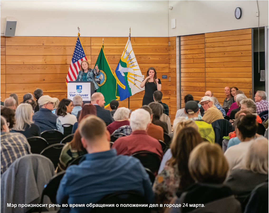
Мэр произносит речь во время обращения о положении дел в городе 24 марта.