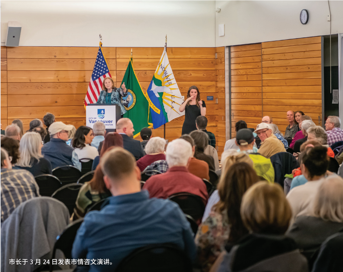
市长于 3 月 24 日发表市情咨文演讲。