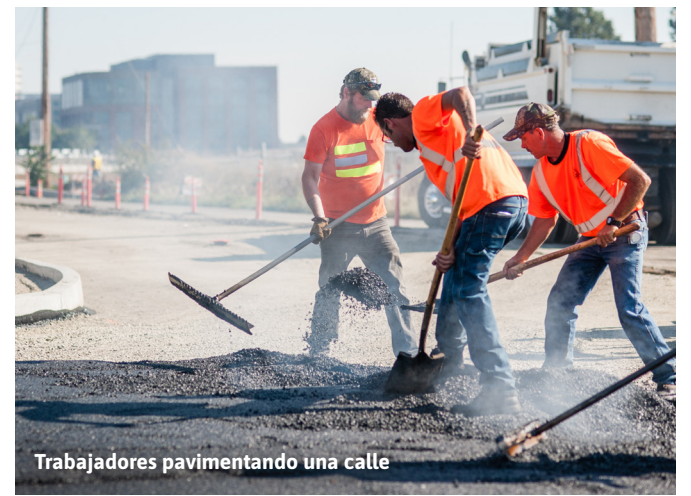
Trabajadores pavimentando una calle

El mantenimiento del pavimento protege y extiende la vida útil de nuestras calles. Los tratamientos de preservación pueden añadir de siete a 11 años de uso, y la repavimentación puede extender la vida útil de una calle de 15 a 20 años.