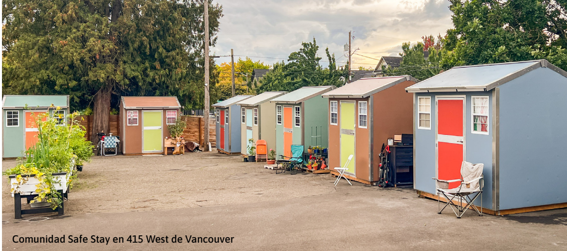
Comunidad Safe Stay en 415 West de Vancouver

Visite cityofvancouver.us/immigration para encontrar el texto completo de la declaración del Concejo y recursos relacionados.