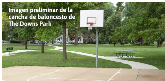
Imagen preliminar de la cancha de baloncesto de The Downs Park

Estas mejoras son parte del trabajo continuo de la Ciudad para mantener los parques barriales acogedores, seguros y divertidos para todas las edades.