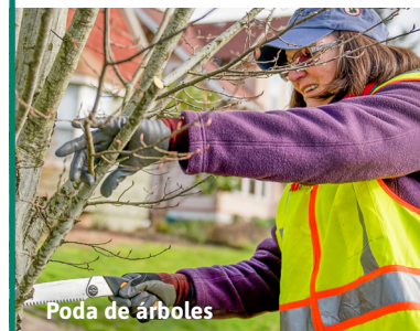
Poda de árboles

Los residentes pueden encontrar orientación, recursos e información sobre cómo contratar arboristas certificados en la página web de Silvicultura Urbana (Urban Forestry) de la Ciudad. Tomar algunas medidas sencillas ahora ayuda a mantener fuerte el arbolado de la comunidad para el futuro.