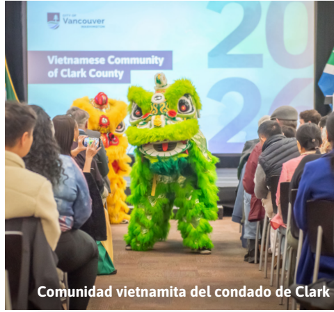
Comunidad vietnamita del condado de Clark