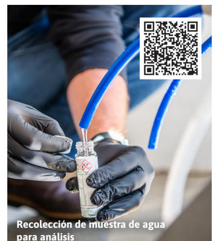
Recolección de muestra de agua para análisis

Vea los resultados de las pruebas de PFAS y lea sobre las acciones que se están tomando para proteger la calidad del agua en cityofvancouver.us/PFAS .