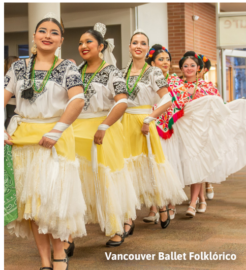
Vancouver Ballet Folklórico