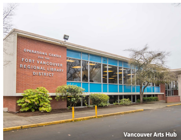
Vancouver Arts Hub

Obtenga más información y comparta sus ideas en beheardvancouver.org/vancouver-arts-hub .