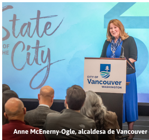
Anne McEnerny-Ogle, alcaldesa de Vancouver

Para ver el discurso del estado de la Ciudad, visite cityofvancouver.us/stateofthecity o escanee aquí.