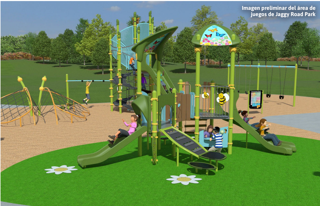
Imagen preliminar del área de juegos de Jaggy Road Park

Visite beheardvancouver.org para obtener más información y compartir sus ideas para futuras mejoras de parques.