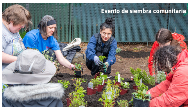
Evento de siembra comunitaria